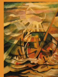
Le Bateau ivre

38 illustrations, gouache, acrylique, pastel et encre de chine sur papier.