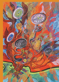
Une Saison en Enfer

38 illustrations, gouache, acrylique, pastel et encre de chine sur papier.