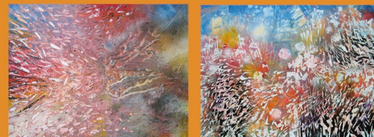
L'éternité , le loup criait sous les feuilles , Ce qu'on dit au poète à propos des fleurs

21 illustrations, Rubson et bombes de couleur sur plaque stratifiée.